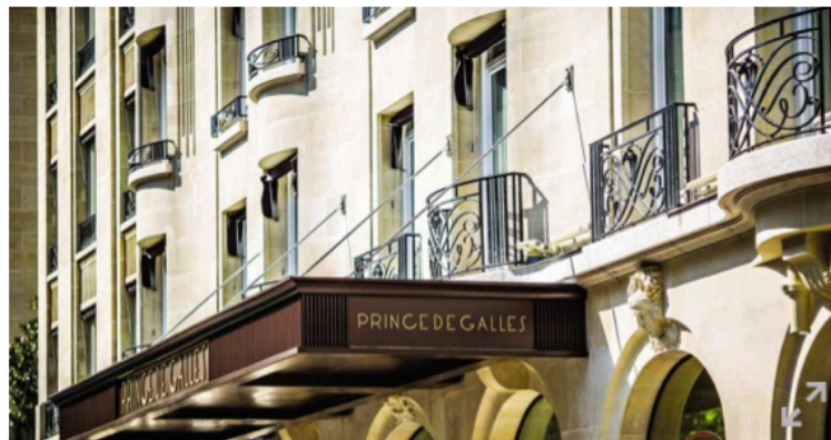
On a testé : le Rituel Divin visage et corps à l'Hôtel Prince de Galles - Benoît Linero